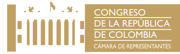
DANIEL CARVALHO MEJÍA Representante a la Cámara por Antioquia